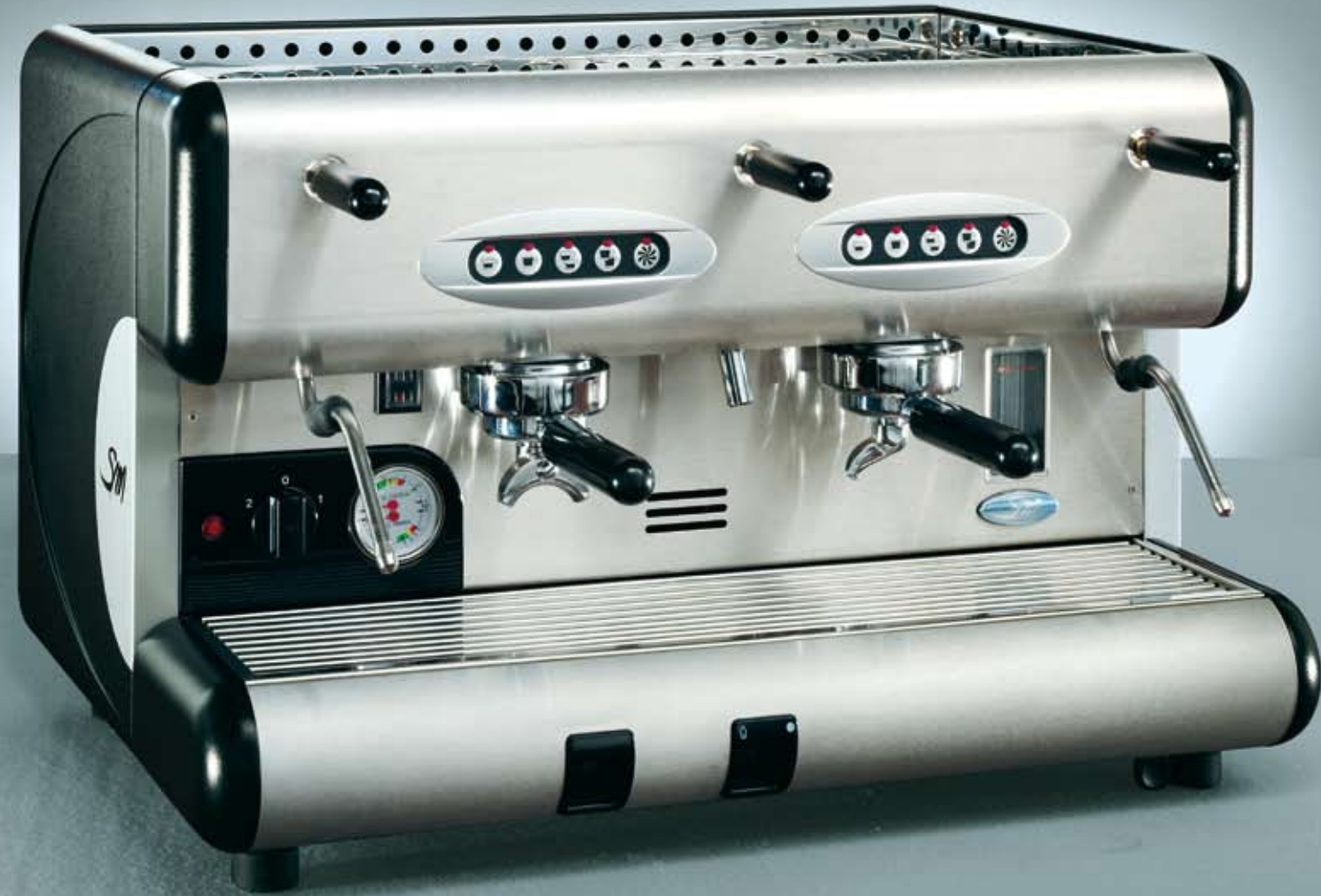
85 E 2 GR.