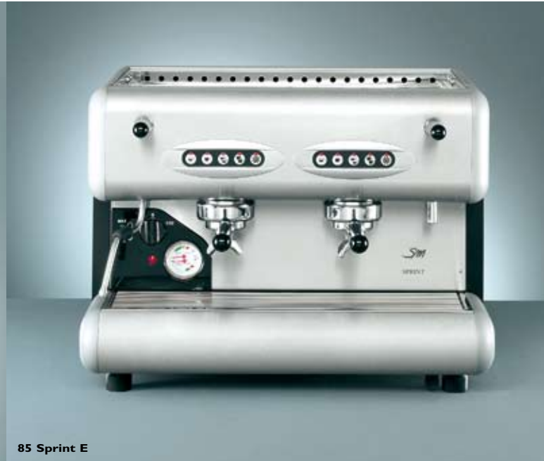
85 Sprint E