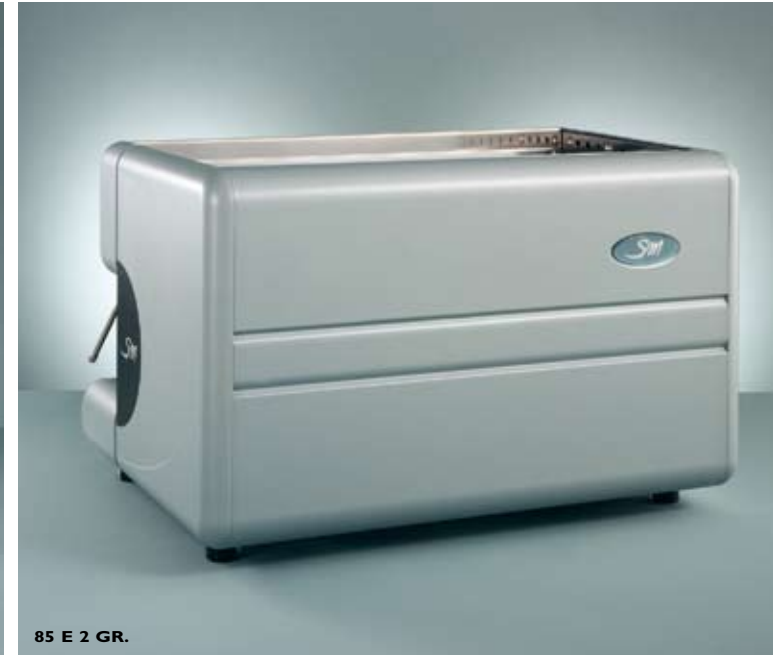
85 E 2 GR.