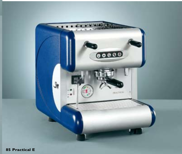
85 Practical E