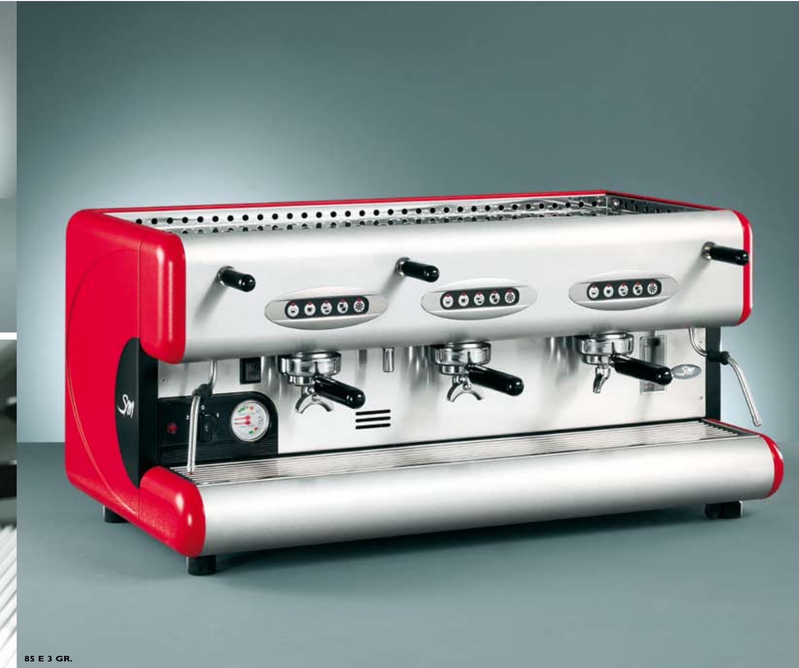
85 E 3 GR.