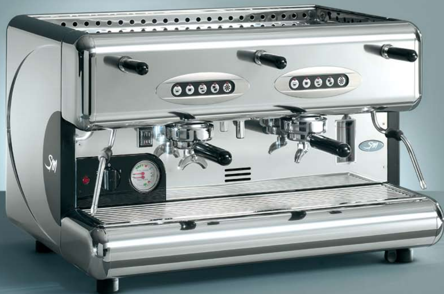
85 E 2 GR.